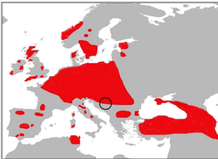
Karta 1: Areal jelena ( Cervus elaphus L.) u Evropi, označen crvenom bojom; prema IUCN 1

Cilj rada je da ukaže na područja u kojima je zabilježeno prisustvo jelena u prošlosti, te da na taj način doprinese eventualnoj reintrodukciji vrste na njena prirodna staništa. Pri tome smo svjesni činjenice da toponimi sa osnovom jelen danas mogu samo djelimično poslužiti ovoj svrsi, jer je u međuvremenu na nekim lokalitetima došlo do značajnih promjena u vegetacionom pokrivaču. Na to je još prije više od sto godina ukazivao Laska (1905), opisujući tadašnje lovne prilike u BiH.