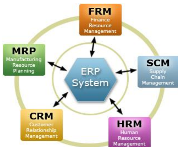
Slika 1-1: ERP sistem

organizaciji u povezane poslovne procese jedinstvenog informacionog sistema. Na taj način ERP obezbjeđuje kontrolu i korištenje svih raspoloživih resursa u organizaciji i zadovoljenje potreba svih korisnika informacionog sistema. ERP sistem posjeduje veoma složenu strukturu, koju čine brojni moduli. Odabirom modula koje žele koristiti, organizacije opredjeljuju nivo složenosti primjenjenog softverskog rješenja. Modularnost ERP sistema se razlikuje od modularnosti tradicionalnih softverskih rješenja. Kod tradicionalnih rješenja, moduli su dijelovi strukture funkcionalnih podsistema i ujedno segmenti pojedinih poslovnih funkcija. Moduli ERP sistema su dijelovi jedinstvenog sistema kao integralne cjeline i u većini slučajeva ih je teško jednoznačno pridružiti određenoj poslovnoj funkciji. Oni pokrivaju poslovne procese koji su po svojoj karakteru multifunkcionani. 2 Standardni ERP sistemi sastoje se od modula koji predstavljaju standardne procese u preduzeću, kao što su finansijski moduli, moduli vezani za ljudske resurse i logistički moduli.