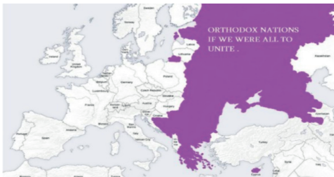
Geografska karta 1 4

Pravoslavnih vjernika u svijetu ima oko 260 miliona, s tim da je 77 % u Evropi, a 1% u zapadnoj Evropi. Najznačajnija i najveća pravoslavna država, svakako je, Rusija sa preko 143 miliona stanovnika od čega 100 miliona pravoslavaca. To je država sa najvećim brojem visokoobrazovanih stanovnika u svijetu 53,5 % (OECD, 2013).