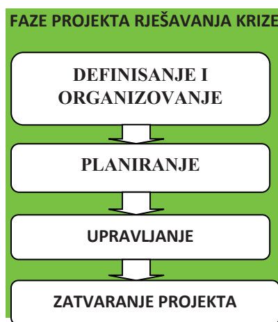
Slika.3. Faze projekta rješavanja krize