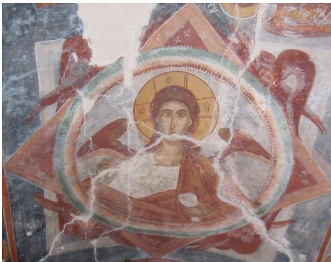
Сл. 8. Христос као Анђео Великог Савјета, Петровићи

Распон између високих, витких фигура из прве зоне и несразмјерно малих фигура из сложенијих композиција из друге зоне потврђује да је ову цркву осликавало више умјетника. Непропорционалност и сликарско несналажење у обради вишефигуралних сцена говори о недовољном искуству и непознавању сликарског заната.