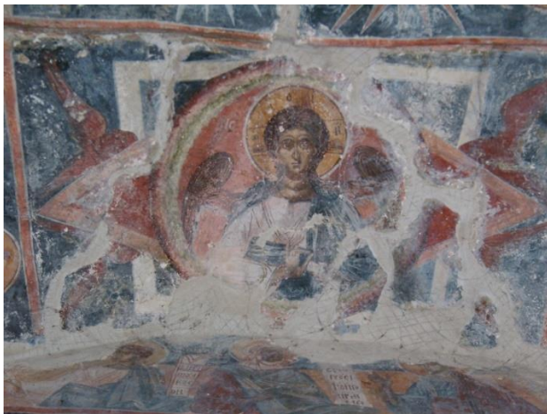
Сл. 6. Христос као Анђео Великог Савјета, Аранђелово

На западном зиду, на уобичајен начин, представљени су и светитељи цар Константин и царица Јелена . Изнад ових ликова, почев од западног зида наоса, преко осталих дијелова зидне површине, наставља се орнаментални фриз са стилизованом палметом. Он раздваја доњу од горње зоне фресака. Из групе мученика у доњој зони јужног зида сачувано је попреје младог светитеља Виктора , чији приказ слиједи упуте из Ерминије. 26 У програм аранђеловачке цркве уврштен је већи број пророка чији су ликови представљени као попреја или цијеле фигуре.