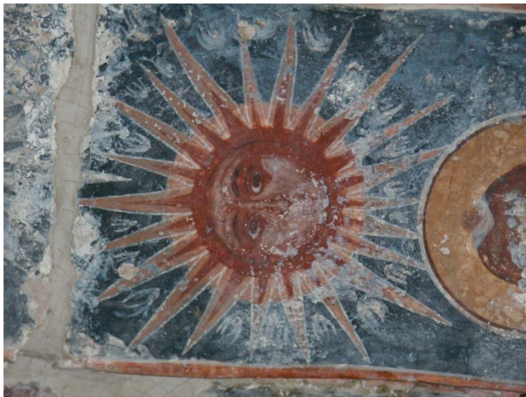
Сл. 9. Антропоморфна представа Сунца, свод наоса, Аранђелово

У поменутиим црквама појављују се готово идентични прикази Сунца и Мјесеца.(сл. 9, 10.) Дакле, врло јасно се уочава стилска сродност између фресака у поменуте три цркве, али у аранђеловачкој цркви недостаје квалитет у обради инкарната, анатомије, као и ритмичност и природност покрета какве запажамо у црквама у Петровићима и Велимљу.