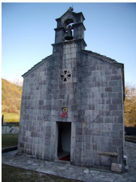
Сл. 2. Црква Светог арханђела Михаила, Аранђелово

Црква Светог арханђела Михаила припада типу цркава који је био заступљен у Далмацији и јужном Приморју још од IX до XI вијека, одакле се проширио у унутрашњост путем градитеља. (сл. 2.) Код оваквог типа цркава обједињене су ортодоксне идеје наручиоца и елементи западнохришћанског стила које уносе дубровачки градитељи. 6