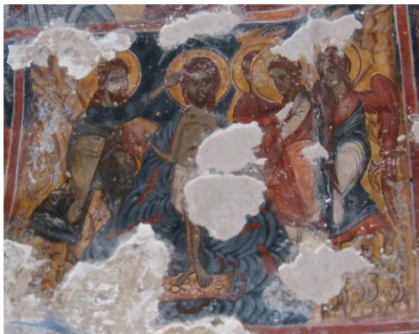
Сл. 4. „Крштење Христово“ Аранђелово

Од српских светитеља у цркви у Аранђелову представљени су Свети Сава Српски и Свети Симеон на уобичајен начин какав је заступљен у српском сликарству, али и у сликарству других дијелова Балкана у XVI и XVII вијеку. 17