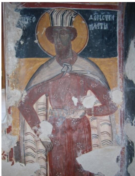
Сл. 5 Свети Теодор Стратилат, Аранђелово

претпоставци стоји и приказ капа на главама ратника Теодора Тирона и Теодора Стратилата из Аранђелова. (сл. 5.) Окомите линије на њиховим капама су поједностављен приказ капа какве можемо видјети на главама ових светитеља у региону Касторије и Корче, као и у црквама на подручју данашње Бугарске и на територији Пећке патријаршије, у којима су ангажовни грчки сликари на позив бугарских или српских поручилаца у XVII и XVIII вијеку. 22 Сличне капе могу се видјети и у Палатицији, 23 а у домаћем сликарству у Ломници, Кучевишту из 1591., Добрском из 1614., Сеславу 1616. године, 24 односно у црквама које су украсили грчки сликари. Раније запажање да су натписи у доњим зонама фресака, као и на свицима пророка у четвртој зони, мјешавина српског и грчког правописа, као и могућност да се аранђеловачки сликар служио грчким приручницима 25 можемо дјелимично прихватити. Може се констатовати да је рукопис у Аранђелову невјешт и нечитак, као и да су натписи већим дијелом уништени.