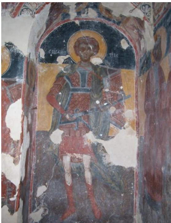
Сл. 7. Свети Димитрије, Аранђелово

Стил умјетника који су живописали цркву у Аранђелову можемо анализирати кроз цртеж, боју, композицију, распоред, начин израде портрета и фигуре. Композиције и самосталне фигуре су солидно организоване и уклопљене у скучен простор цркве. У сложенијим, вишефигуралним сценама умјетник је показао неспретност у приказу фигура. Очита је непропорционалност јер су фигуре смањене по висини. С друге стране, запажају се предимензиониране појединачне фигуре, као што је фреска арханђела Михаила. Дакле, преовладава цртачка неуједначеност, која је највјероватније посљедица рада више умјетника. Појединачне фигуре су анатомски боље рјешене. То се може уочити на фигурама светих ратника, посебно Димитрија и Георгија.