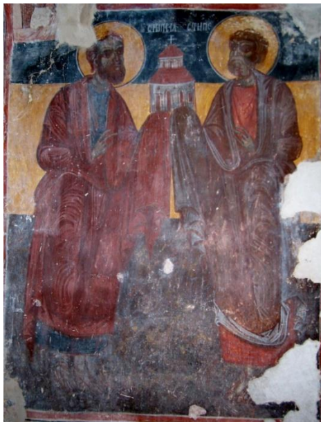
Сл. 3. Свети Петар и Павле, Аранђелово

У првој зони наоса, на западном зиду са сјеверне стране, представљени су цар Константин и царица Јелена . Ови светитељи веома често се приказују у мањим црквама у источној Херцеговини током XVI и XVII вијека. С јужне стране западног зида су апостоли Петар и Павле , (сл. 3.) фреска која се не појављује често у зидном сликарству мањих цркава на подручју Пећке патријаршије. Западни зид носи сцену Успење Богородице која је приказана на уобичајеном мјесту. У највишој зони западног зида представљена су три попресе непознатих светитеља. Припрата није осликана.