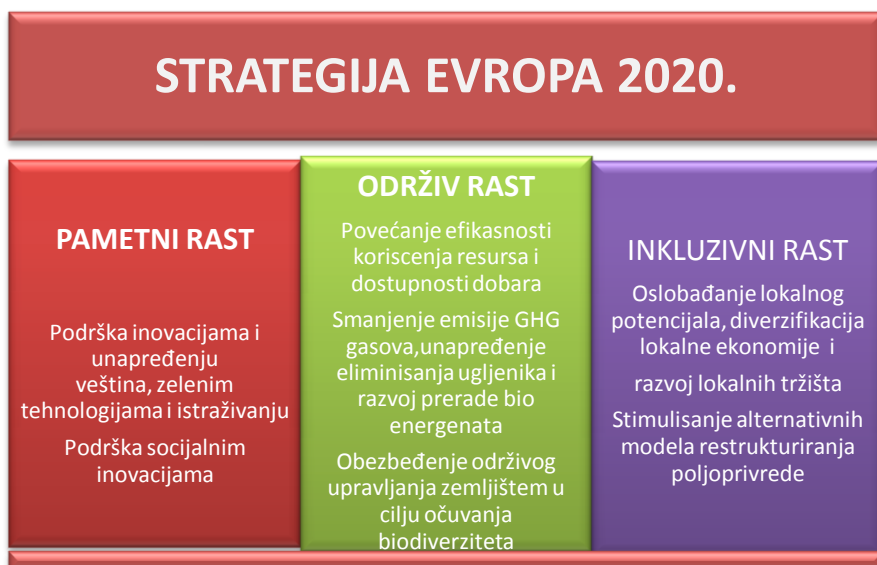
Grafikon br. 1. Ciljevi strategije Europa 2020.

U Strategiji Europa 2020 prepoznata je važnost unapređenja pružanja usluga zaštite životne sredine kao dio većeg izazova usmjerenosti ka efikasnom privrednom razvoju, što je naglašeno i u posebnim prioritetima politike ruralnog razvoja za period 2014–2020. Bitno je naglasiti da se briga za životnu sredinu, zajedno sa doprinosom ublažavanja i prilagođavanja klimatskim promjenama smatraju zajedničkim ciljevima svih Programa ruralnog razvoja (PRR). Kako bi dala podršku i vjetar u leđa provođenju ciljeva ruralnog razvoja EU definisala je i financijske mehanizme, prvenstveno EEFRR 5 iz kojeg Evropska unija dobija najviše sredstava za održivo korišćenje zemljišta i unapređenje pružanja usluga zaštite životne sredine u svim zemljama članicama.