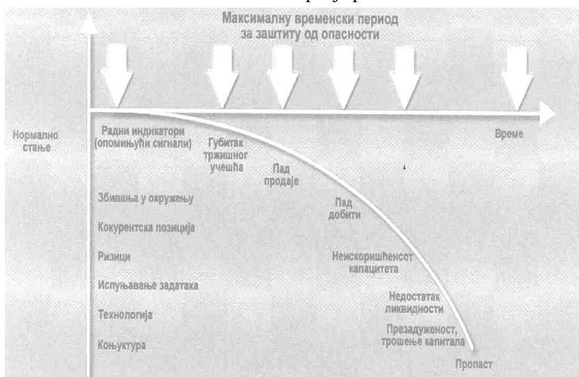
Slika 1: Tok nastupanja problema