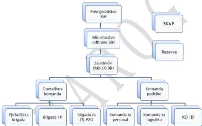
Šema 2. Lanac komandovanja Oružanim snagama

Obavještajno-bezbjednosna agencija BiH - OBA osnovana je Zakonom o Obavještajno-bezbjednosnoj agenciji na sjednici Predstavničkog doma 22. marta 2004. godine, i kasnije sjednici Doma naroda. Nastala je spajanjem civilnih obavještajno-bezbjednosnih institucija, koje su ranije djelovale na prostoru Federacije BiH (Federalna obavještajna, sigurnosna služba) i RS (Obavještajno-bezbjednosna agencija). Nova agencija je civilna obavještajno-bezbjednosna institucija, sa statusom pravnog lica i preciznim nadležnostima na cijeloj teritoriji BiH. Bavi se prikupljanjem, analiziranjem i distribucijom obavještajnih podataka, u cilju zaštite bezbjednosti uključujući suverenitet, teritorijalni integritet i ustavni poredak BiH. Veliku pomoć u organizovanju, opremanju i osposobljavanju ključnih kadrova, imale su specijalizovane ekipe NATO i zapadnih zemalja.