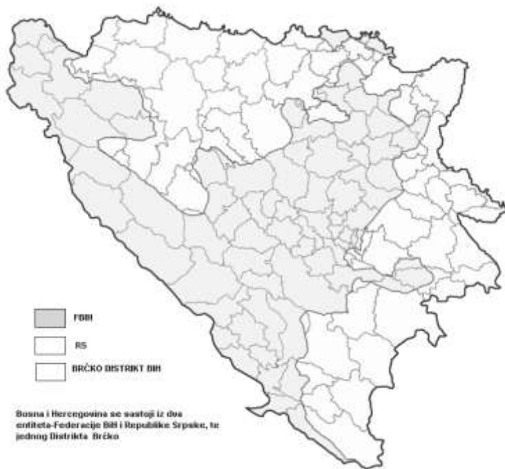
Slika 1. Podjela BiH na entitete i distrikt

zakonskim aktima. Kao stanje, bezbjednost isključuje postojanje materijalnih i drugih akata uperenih protiv ustavnog poretka, nezavisnosti, suvereniteta, teritorijalnog integriteta, oružanih snaga i drugih vrijednosti, koje predstavljaju zaštićena dobra... 101